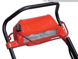
照明ヘッドライト付