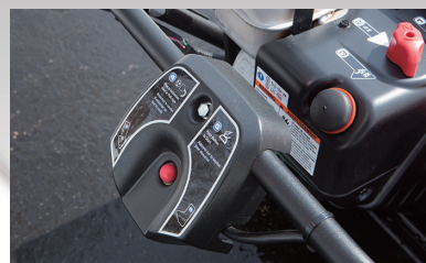
ワンタッチ! AC100V電動スターター (コードは市販品をご使用ください)