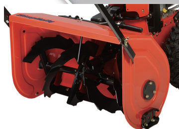
余裕の除雪幅! 強力オーガー装備