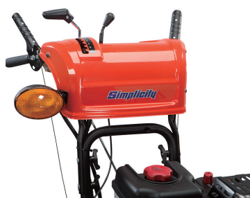
照明ヘッドライト付、ヒーター付ハンドル