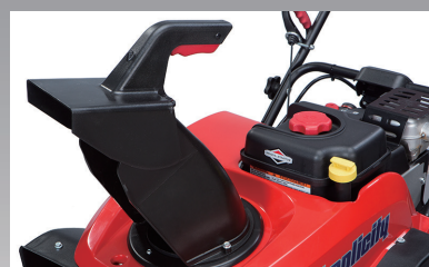
電動旋回シューター(上下操作は、手動)