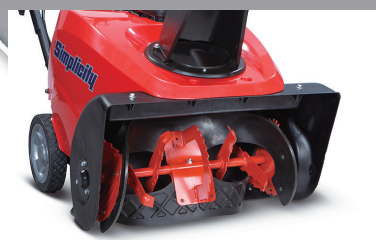
パワフルなシングルステージ構造、金属補強入りゴムオーガ