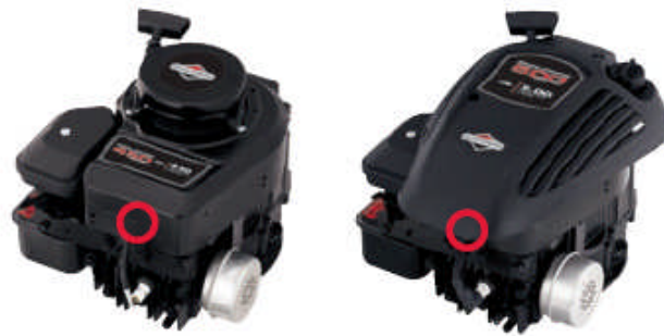
400 Series™, 500 Series™ Classic™, Sprint™, SQ™, Q™