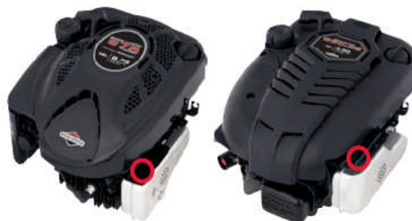
600 Series™, 800 Series™ Quantum®, Intek™